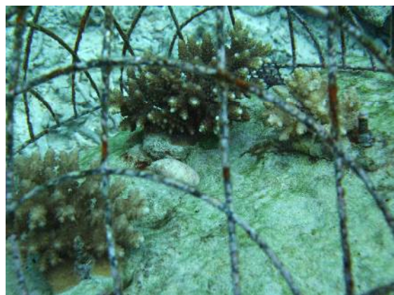
去年植えつけたヤッコミドリイシ