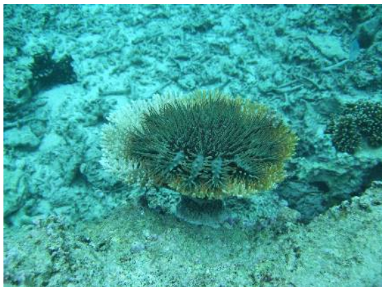
湾内で駆除したオニヒトデ

オニヒトデ駆除は、植え付けサンゴ周辺及び万座の湾内で広範囲に行いました。その結果、湾内で1匹を駆除しました。