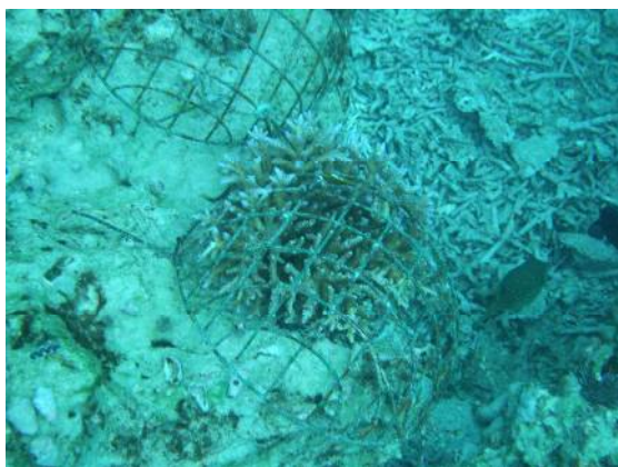
成長したタチハナガサミドリイシ